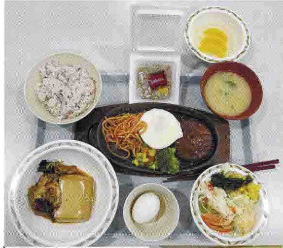
「新東京食堂」では「家庭」の「おこし」をコンセプトに、学生が楽しめるメニューを提供している。写真は2019年11月のもの

コロナが落ち着いたら、ぜひとも訪れたい場所が国士舘大学多摩キャンパス学生食堂。1992年の多摩校舎(現多摩キャンパス)開設と同時にオープンした「新東京食堂」と、2016年に完成したメイプルセンターユリイセンター多摩(MCCT)に位置する「MCCT食堂」。魅力的な学食が2つもあり、リーズナブルな一般学生向けはもちろん、体育会系クラブの学生向けに「クラブ食」を提供している。高校生にとって、進路選びにもプラス材料となるはずだ。(写真は2019年11月のもの)