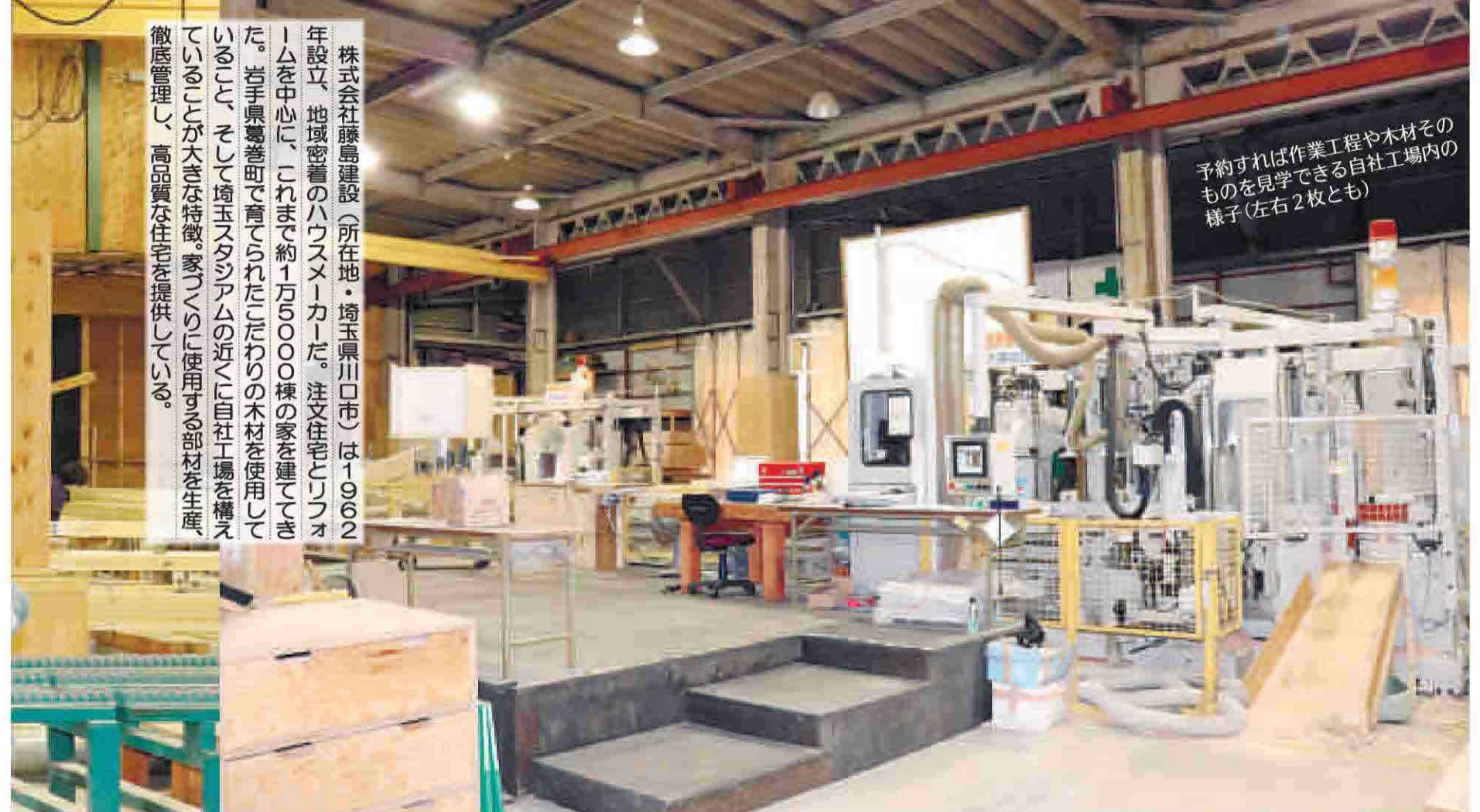
予約すれば作業工程や木材そのものを見学できる自社工場内の様子（左右2枚とも）

株式会社藤島建設（所在地・埼玉県川口市）は1962年設立、地域密着のハウスメーカーだ。注文住宅で「リフォーム」を中心に、これまで約1万5000棟の家を建ててきた。岩手県葛巻町で育てられたこだわりの木材を使用している。そして埼玉スタジアムの近くに自社工場を構えていることが大きな特徴。家づくりの現場を徹底管理し、高品質な住宅を提供している。