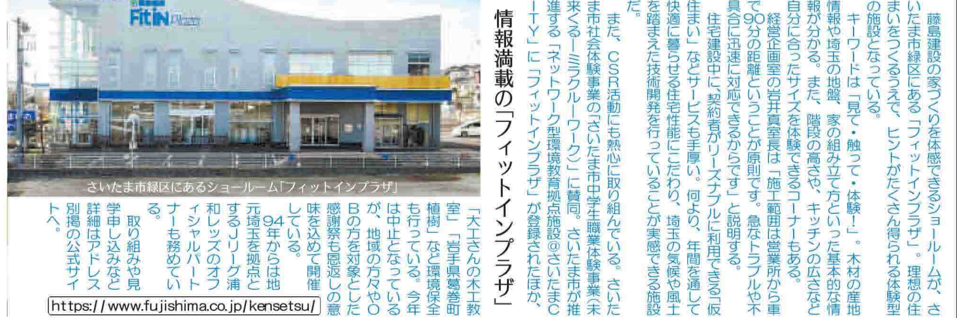
さいたま市緑区にあるショールーム「フィットインプラザ」