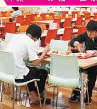
拓殖大学B館地下1階にある食堂。椅子は416席

拓殖大学の文京キャンパスは、東京メトロ丸の内線「茗荷谷駅」下車徒歩3分とアクセス抜群。正門からほど近いB館地下1階にある学生食堂はリーズナブルでメニューが豊富。一般にも開放されているので、高校生も利用できる。とにかく財布にやさしいので食欲の秋にぴったりだ。 清潔広い この秋、清潔で広々とした空間を、導入しているフェアで、始業前にお腹もいっぱい、拓殖大学の学生にも大好評だ。商学部1年が誇る学生食堂を利用すれば、誰もが満足すること間違いなしだ。 品数豊富 フェア以外のレギュラーメニューも充実している。大学を象徴する「拓大橙(だいだい)」丼は420円、大モン(だいだい)、ライスを中心に、ライスをメインにしたメニューも豊富だ。また、とんかつ、唐揚げ、3人組が150円の「めざまし朝ごはん」は料理は作れない。150円で料理は作れない。150円で料理は作れない。 いつでも このように理想的な空間となっている学生食堂は、うれしいことに一般利用も可能だ。という。昼の混雑時は学生が優先となるが、夏休み期間や、平日でも時間をずらせば誰もが快適に利用できる。 財布安心 今日10日限定10食で提供される「ムスリムディッシュ」(280円)、「文京丼」(370円)、「カレー」(450円)など、人気メニューも豊富だ。 ママ友とお子さんが楽しく食事 ママ友とお子さんが楽しく食事。ママ友とお子さんが楽しく食事。 「ムスリムディッシュ」1日限定10食450円 「拓大橙丼」420円