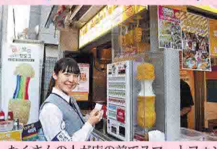
虹色の伸びるチーズが映える「レインボーハットグ」