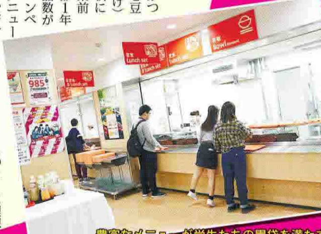
豊富なメニューが学生たちの胃袋を満たす