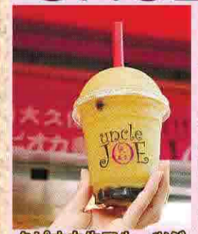
タピオカ生フルーツジュースは一度飲んだら忘れられない