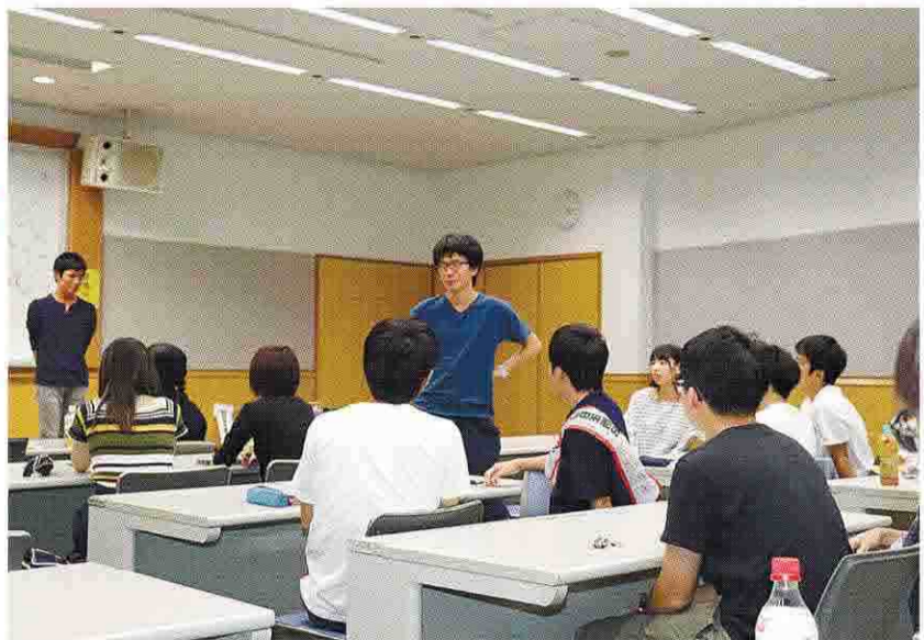
夏合宿初日の様子

14年設立 おりがみは14年8月に誕生した。当時千葉大1年の都築代表が宇宙航空研究開発機構(JAXA)の宇宙清掃活動「JAXAの宇宙清掃活動」を行っていたが、15年に東京オリンピック・パラリンピック競技大会組織委員会が主催する地域巡回型フォーラムで発言がきっかけだった。