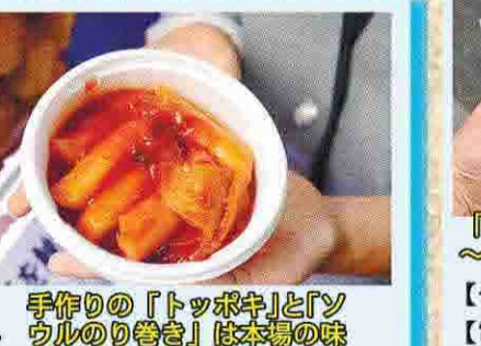
手作りの「トッポキ」と「ソウルのり巻き」は本場の味

休日は警備員もいるほど大人気のソウル市場。韓国食品の品ぞろえが豊富なスーパーマーケットだ。ここでのオススメは、店内で手作りされているソウルのり巻きとトッポキ。必ずしも見た目はインスタ映えとは言えないが、本場の味を楽しむことができる。しっかりとした弾力感のあるトッポキはピリ辛で体が芯から温まり、ソウル風の巻きは、ごま油の香りが程よくアクセントになっていて、具たくさんなので食べ応えも抜群。どちらも飽きない味だ。店内ではキムチの試食もできる。