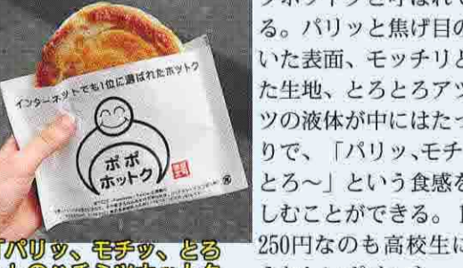
「パリッ、モチッ、とろ〜」のハチミツホットク

常に行列が絶えない店は黄色い看板が目印。オススメはハチミツホットクだ。ハチミツといっても、実は本当にハチミツが入っているわけではない。黒砂糖・シナモン・ナッツが生地の中に入れており、生地を焼いた際、黒砂糖が溶けてハチミツのような液状になることから、ハチミツホットクと呼ばれている。パリッと焦げ目のついた表面、モチリとした生地、とろとろアツアツの液体が中にはたっぷり、「パリッ、モチッ、とろ〜」という食感を楽しむことができる。1つ250円なのも高校生にはうれしいポイント。