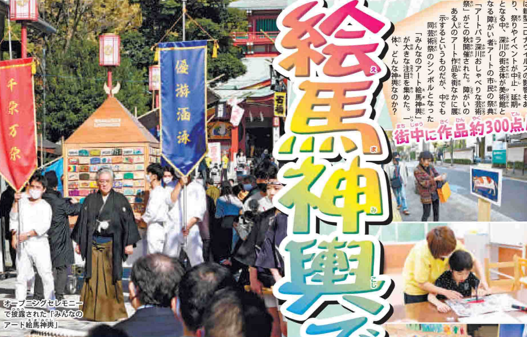
オープニングセレモニーで披露された「みんなのアート絵馬神輿」