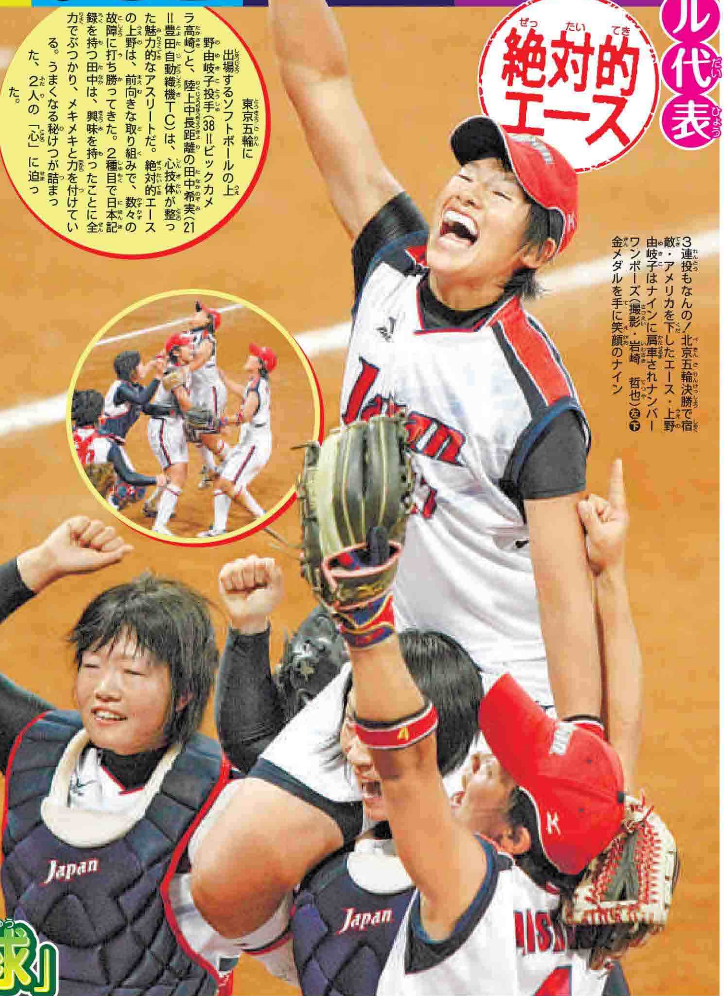
3連投もなんの北京五輪決勝で宿敵・アメリカを下したエース・上野由岐子はナインに肩車されナンバードンポーズ金メダルを手に笑顔のナイン

出場するソフトボールの上野由岐子投手(38)は、心技体が整った魅力的なアスリートだ。絶対的エースの上野は、前向きな取り組みで、数々の故障に打ち勝ってきた。2種目で日本記録を持つ田中は、興味を持って全力でぶつかり、メキメキと力を付けている。うまくなる秘けつが詰まった、2人の「心」に迫った。