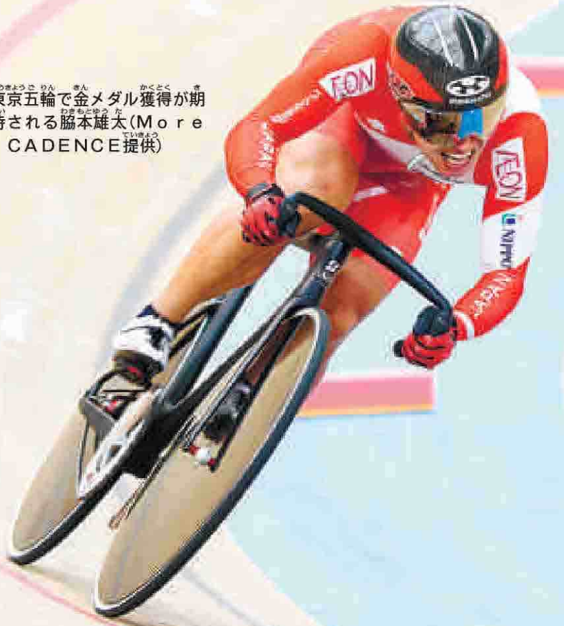
東京五輪で金メダル獲得が期待される脇本雄太