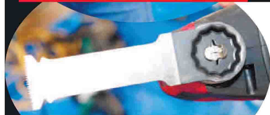
30度刻みで角度も変えられる