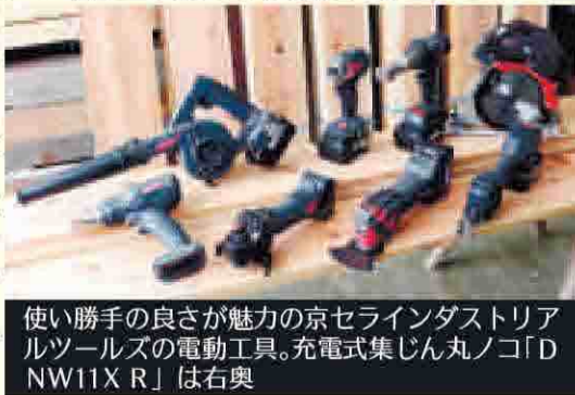
使い勝手の良さが魅力の京セラインダストリアルツールズの電動工具。充電式集じん丸ノコ「DNW11XR」は右奥

18mmの充電式インパクトドライバーや、充電式ディスクグラインダーなど多くの製品がそろっている。