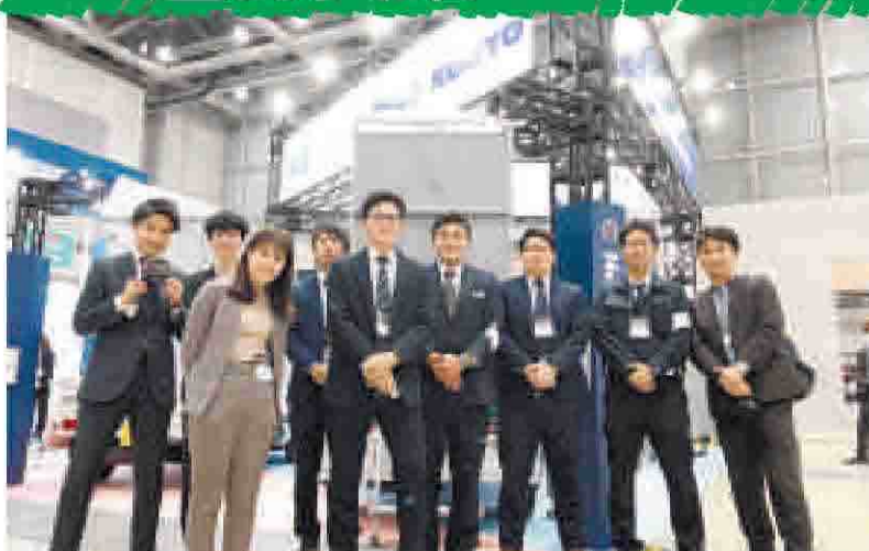
若さあふれるマンパワーが日野興業の力の源 谷本部長(左)と熊本チーフ 多彩な製品ラインアップ