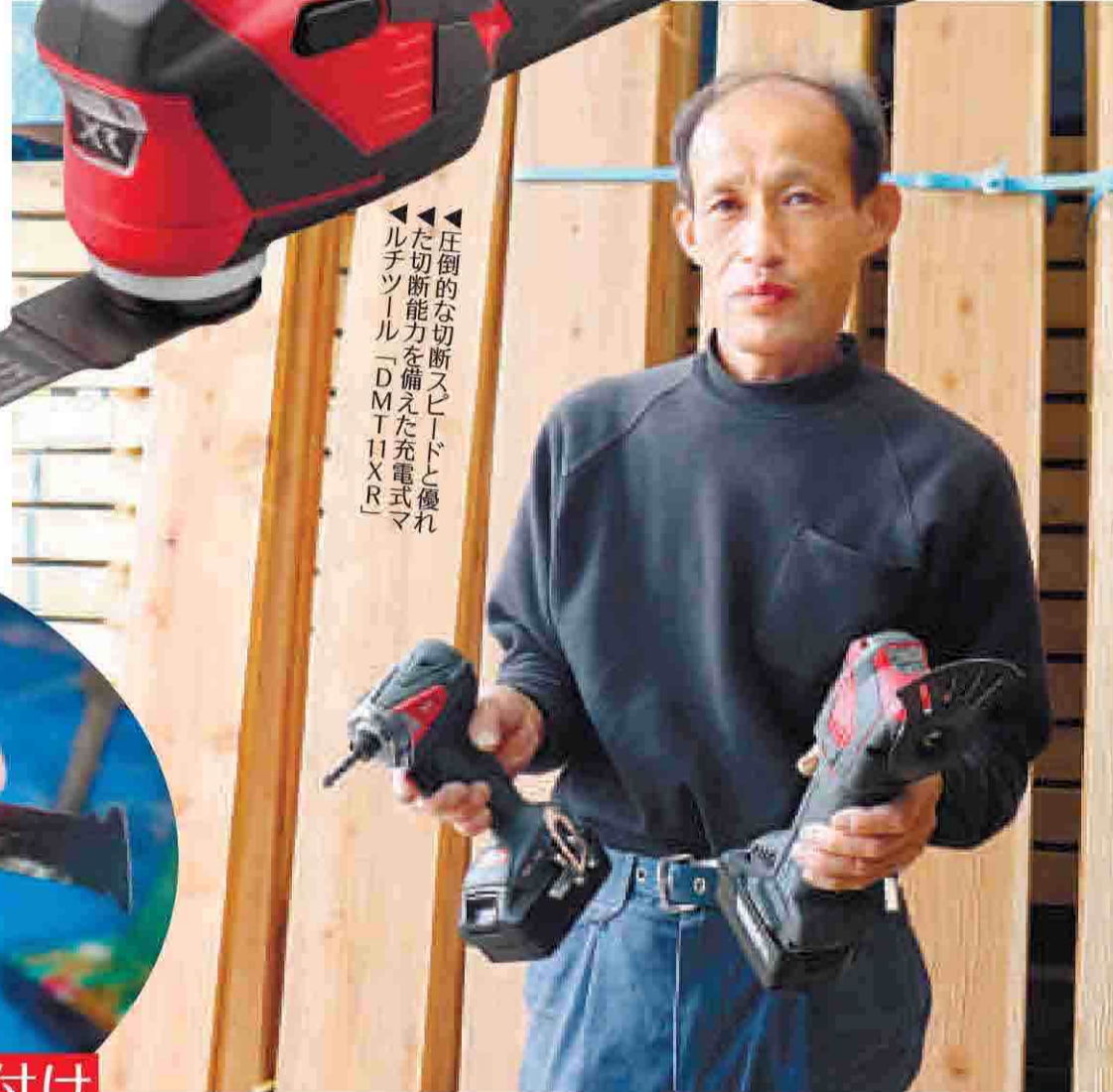
圧倒的な切断スピードと優れた切断能力を備えた充電式マルチツール「DMT11XR」