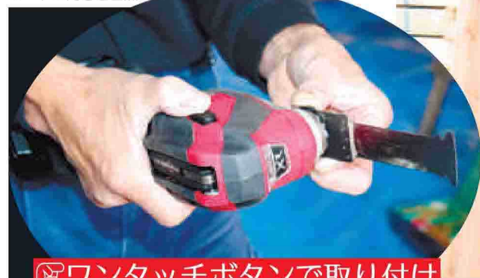
ワンタッチボタンで取り付け